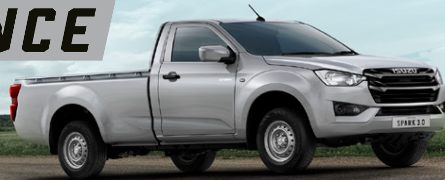
Bohemian Silver Metallic