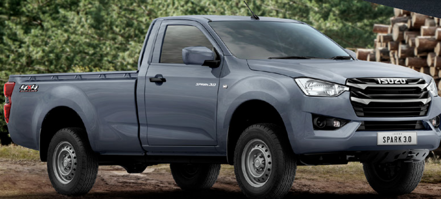
Islay Gray Opaque